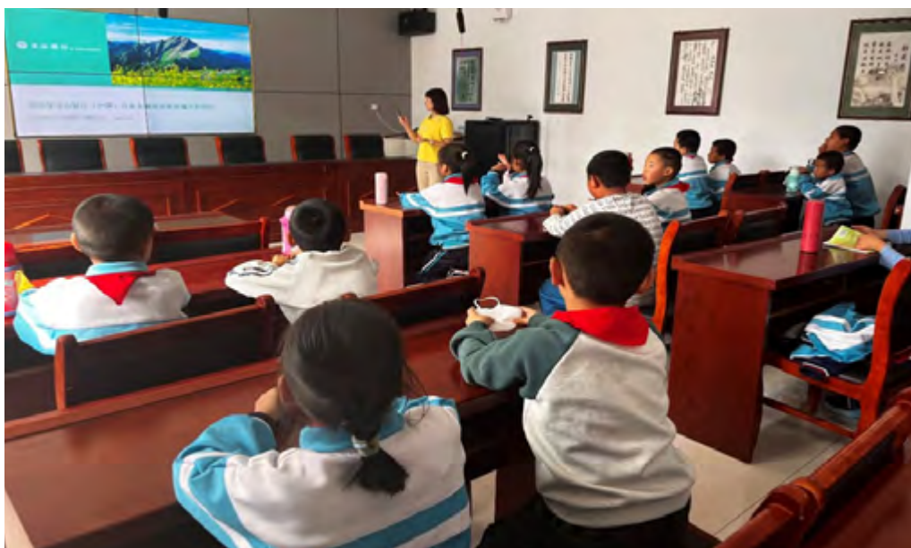
学生认真地了解金融知识

此外，本行资深法律从业人员在回访时，为当地学生讲授生动有趣的金融知识启蒙课程，有效提升学生们的风险识别与自我保护能力，将金融安全的种子播撒在希望的田野上。