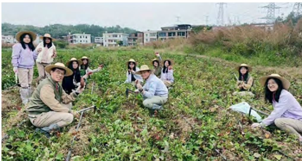
同仁参与红薯收成

12月是红薯成熟阶段，本行组织同仁参与红薯收成，倡议更多同仁实际参与社会公益活动，与玉山一同为营造更美好的世界而努力。本行亦将这批承载着岭南阳光与农民汗水的红薯，跨越数千公里，送往内蒙古察右后旗偏乡小学，让这份从南方传递到北方校园孩子们手中的温暖，更加香甜。