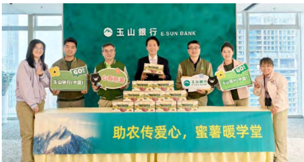
红薯寄送内蒙古察右后旗偏乡小学