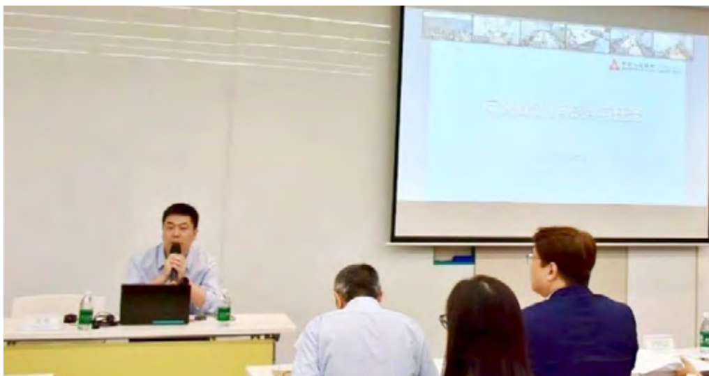
邀请人民银行深圳市分行反洗钱处为深圳外资行授课

本行积极响应国家金监总局 2025 年金融教育宣传周预热活动与反诈工作要求，于 2025 年 9 月 9 日联合深圳市银行业协会外资银行工作委员会及深圳经济特区金融学会反洗钱专业委员会举办深圳市全辖外资银行反电诈、反洗钱及消费者权益保护培训会，邀请中国人民银行深圳市分行反洗钱处处长、深圳市公安局刑侦支队队长及中资银行反洗钱部门资深工作人员为讲师分析当前电诈与洗钱犯罪趋势与最新案例，提升全辖外资银行反电诈反洗钱工作能力。