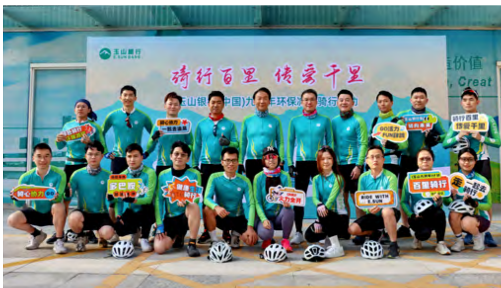
绿色骑行活动照片

2025年,本行开展2次环保登峰活动及1次环保减碳骑行活动,发挥“一份爱牵引更多爱”的精神,结合玉山人的力量,传递正向能量,为广大顾客提供优质金融服务的同时也投入环保公益活动中,本行将持续以行动展现爱与关怀,共建绿色美丽家园,实现企业永续经营,支持社会的可持续发展。