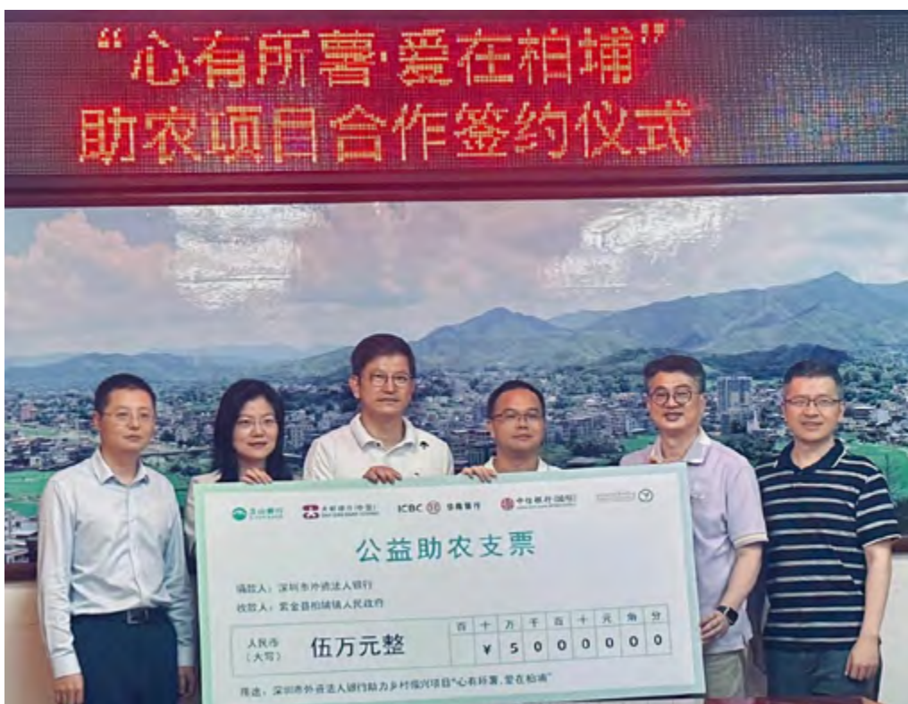
深圳五家外资法人行与当地农户的签约仪式

除科技赋能乡村教育，本行更是积极发挥影响力，牵头深圳四家外资法人行在河源市紫金县柏埔镇发起“心有所善·爱在柏埔”产业帮扶项目，盘活当地限制土地资源，促进良洞村村民扩大就业，振兴农业发展。本行深化与当地政府、监管部门的协作，助力柏埔镇朝着产业兴旺、生态宜居的乡村振兴目标稳步迈进。