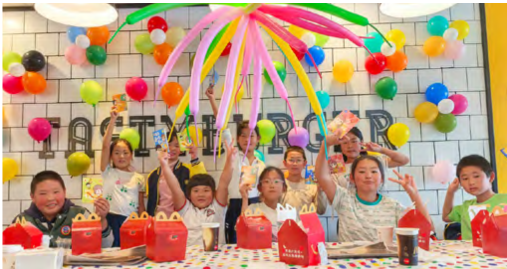
赉红学校学生至科技馆研学后享用午餐

察右后旗乡村留守学生家庭经济条件有限，学生普遍面临餐食营养不足的困境，2023年本行实地调研了解学校需求后，即开始对该地区赉红学校、大六号学校捐赠餐补金，提升学生餐质。2025年，更是积极响应国家金融监督管理总局察右后旗监管支局倡议，参与“金融暖阳·营养未来”乡村小学爱心营养餐改计划，助力该地区乡村小学营养改善计划，本行于该地区的餐质提升捐赠效益由两所学校扩宽至该地区全部乡村学校。本行善举亦获得当地政府、察右后旗监管支局的肯定与致意。