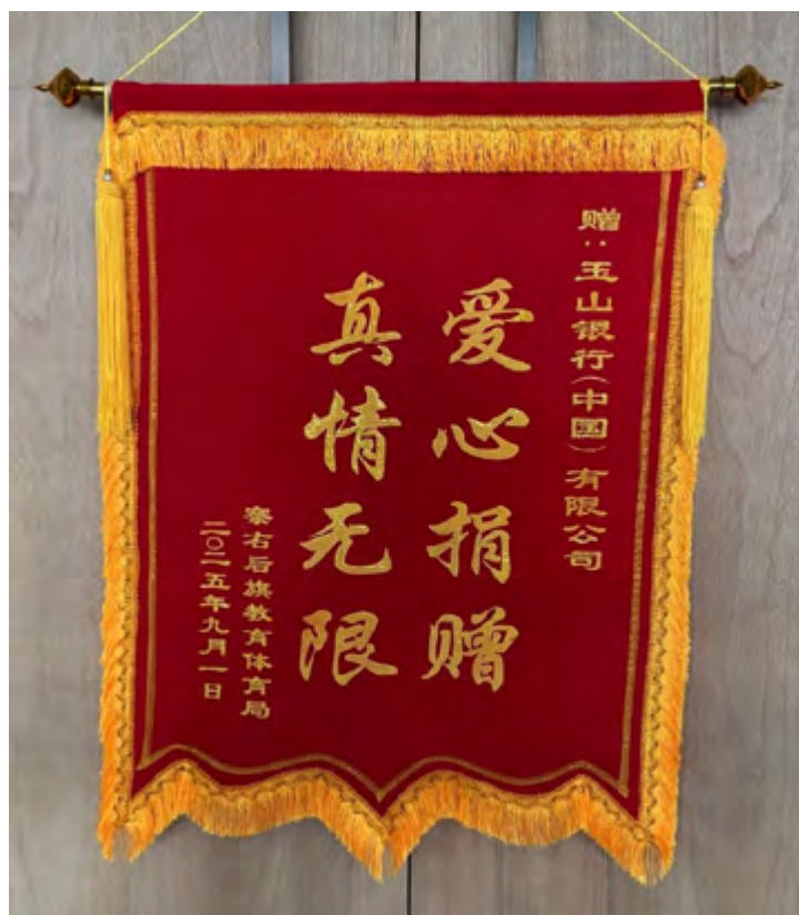
内蒙古察右后旗教育体育局颁发之锦旗

此外，本行资深法律从业人员在回访时，为当地学生讲授生动有趣的金融知识启蒙课程，有效提升学生们的风险识别与自我保护能力，将金融安全的种子播撒在希望的田野上。