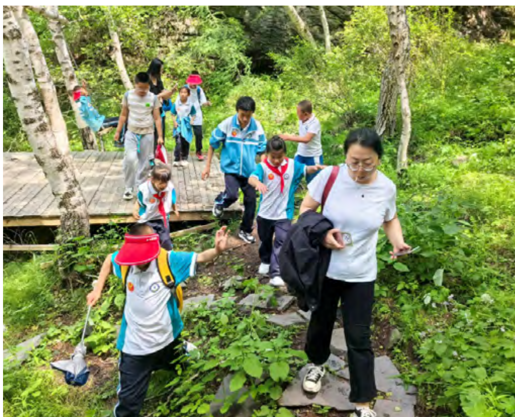
捐助内蒙古大六号学校至苏木山研学

截至2025年，本行已连续七年向内蒙古察右后旗偏远乡村小学提供捐助，已协助该地区三所小学完成老旧电脑设备更换，大幅改善当地信息化教学条件。为拓展当地学生视野，增加多元化学习体验，本行全额支持大六号学校举办“踏寻苏木山·解锁自然密码”研学活动，学生们实地观察各植物品种，了解自然界的奥秘，知识库得到丰富。本行志愿者更是亲身参与赉红学校开展“探秘科技之光·感悟历史文脉”研学活动，参观当地科技馆研学活动。开展研学活动是弥合城乡教育体验差距的一大举措。