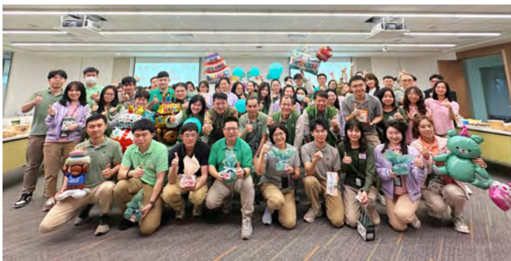
每季度举办员工生日会