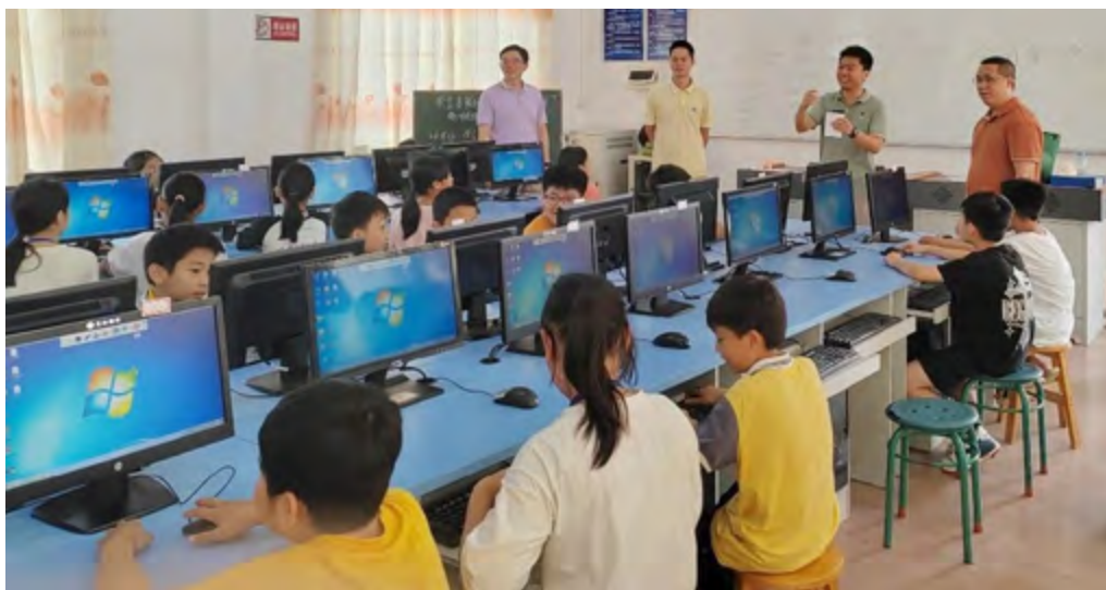
志愿者于河源柏埔镇中心小学教授计算机课程

计算机教学设备外，让教育资源突破时空限制，本行志愿者设计趣味性与实用性兼具的课程方案，精心录制计算机基础教学视频提供学校教学使用，为学生们构建数字化时代核心竞争力，实现科技教育从理念到实践的温暖落地。