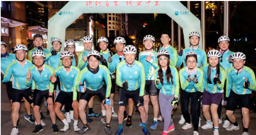
绿色骑行活动照片

本行持续推行绿色办公，开发综合办公系统并推广使用，实现公文流转全程电子化，在全行鼓励线上会议系统，采取网盘共享方式传输会议资料，推动减少会议用纸。稳健有序推动全行节能降碳工作，争取绿色发展，将是本行持续努力的目标。